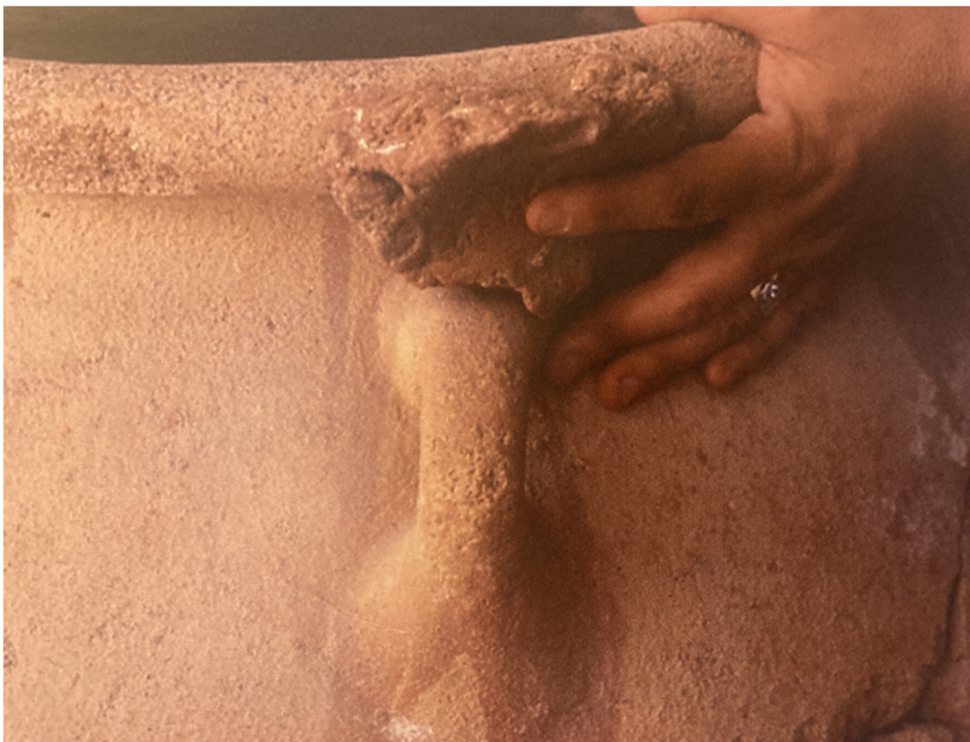
Pithos e cretula da Monastiraki, Creta, MMIB, 1700 a.C..