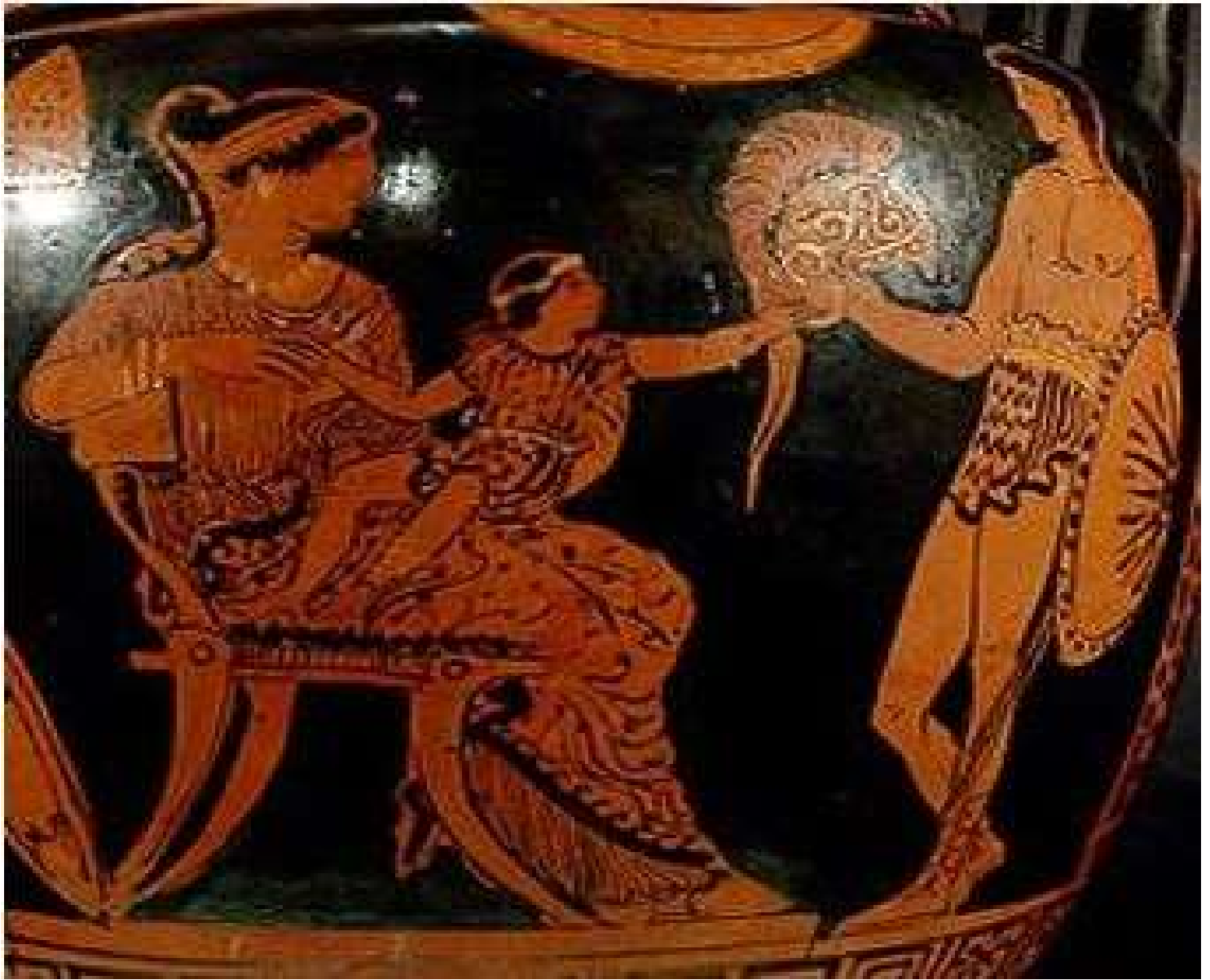
Ettore, Andromaca e Astianatte